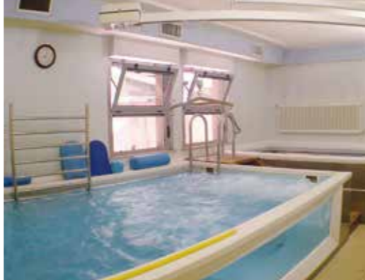
Vasca terapeutica con acqua a temperatura costante di 35° e idromassaggio

Sono inoltre presenti una palestra per la riabilitazione, vasche per idrokinesiterapia.