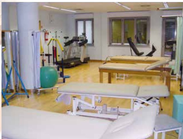
Palestra per pazienti ambulatoriali